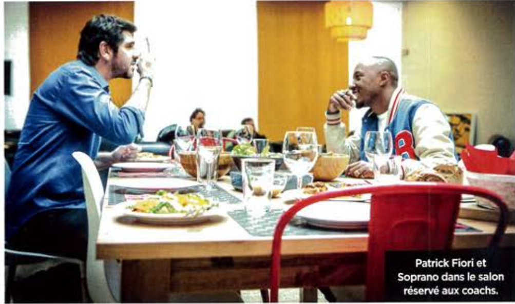
Patrick Fiori et Soprano dans le salon réservé aux coaches.

Un vent de folie semble avoir soufflé sur le plateau de The Voice Kids . Alors que le programme va bientôt reprendre ses quartiers sur TF1, avec, aux commandes, les fidèles Nikos Aliagas et Karine Ferri, devenue maman pour la deuxième fois le 16 juillet dernier, l'ambiance n'a jamais été aussi amicale et festive que lors de la préparation de cette saison 5. La raison ? Les quatre coaches se respectent et sont amis dans la vraie vie. Soprano et Patrick Fiori sont tous deux originaires de Marseille. Ils y ont même tourné le clip de leur duo Chez nous , un titre signé Jean-Jacques Goldman, dans lequel ils racontent leur enfance dans la cité phocéenne. Quant à Amel Bent et Jenifer, elles ne se quittent plus depuis qu'elles participent ensemble aux Enfoirés . Une alchimie visible sur le plateau de la Plaine Saint-Denis où a été enregistrée une partie des émissions en octobre 2017. Des coaches complices, se levant pour improviser des pas de danses endiablés en invitant le public. Du jamais-vu. Lorsque nous avons demandé à la production si les émissions étaient scénarisées, la réponse fut un non catégorique. Les artistes sont libres, livrés à eux-mêmes sur le plateau, sans oreillettes et dans l'improvisation totale. Alors forcément, parfois, ils en oublient les caméras et se prennent un « petit coup de recadrage » par le réalisateur. Mais rassurez-vous, s'ils sont potes, les guéguerres pour récupérer des talents – un classique de l'émission – pimenteront la partie.